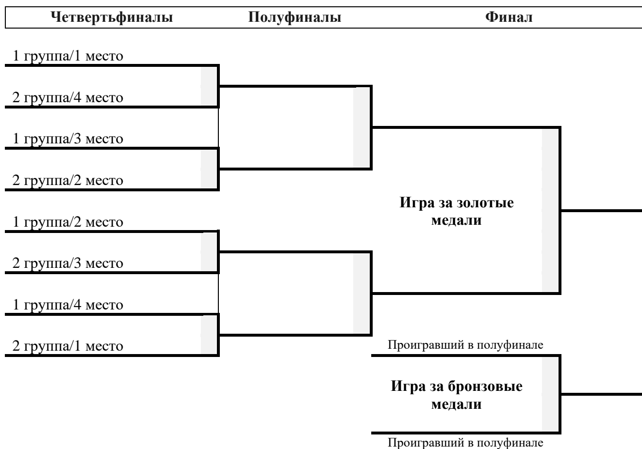
Схема плей-офф Детской Суперлиги